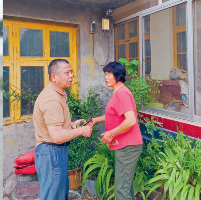
rechts: Die Familie des Lieferanten kultiviert im eigenen Hof viele verschiedene Kräuter als botanische Sammlung

So werden manchmal selbst Sorten, die an sich nicht betroffen sind, erst verzögert geliefert.