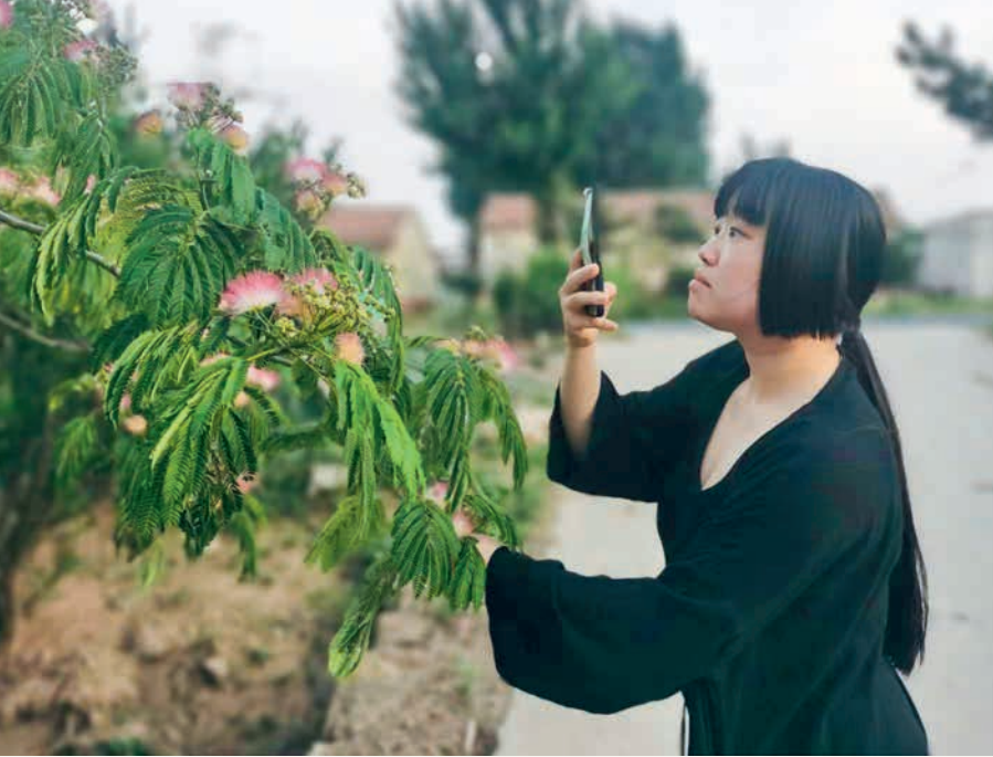
links: „ Albizia julibrissum “, Seidenbäume, blühen im Juni, im Herbst werden die Samen gesammelt